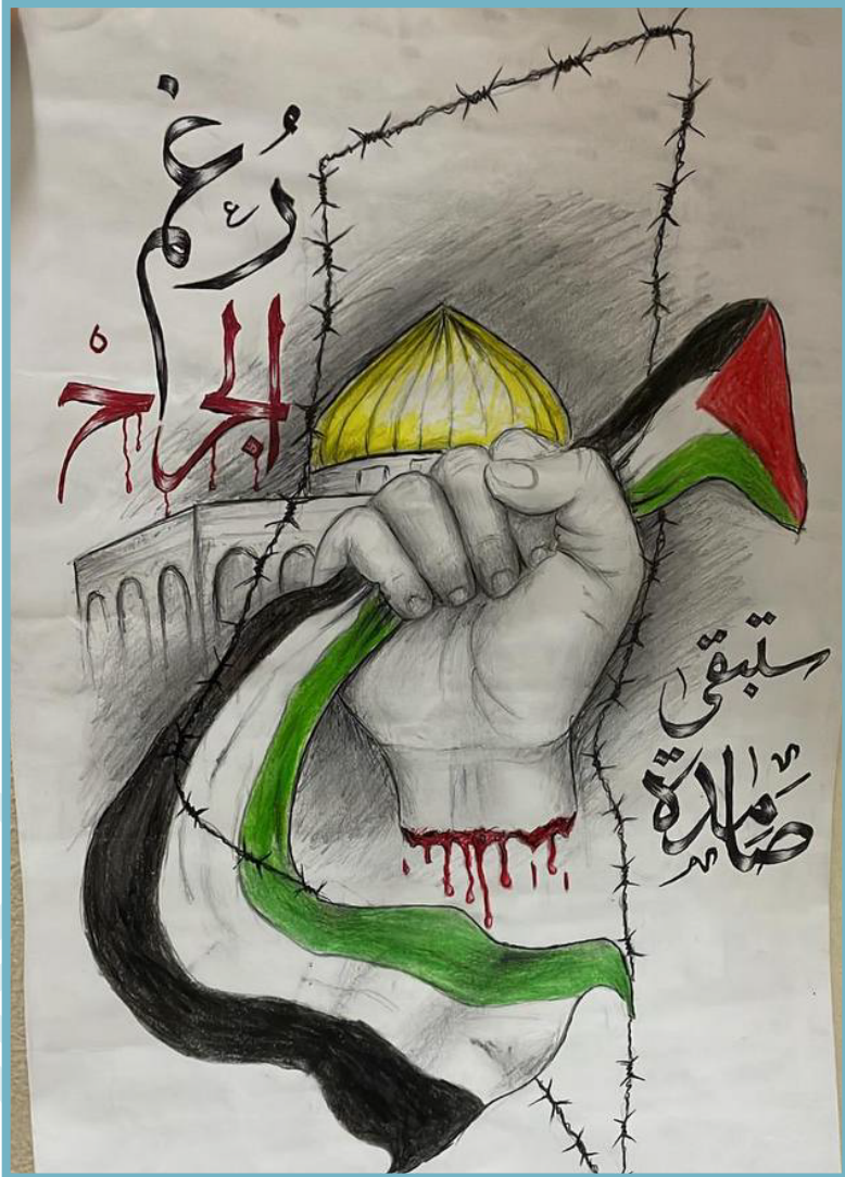
الرسام المعتقل علي مهدي علي (بني جمره)